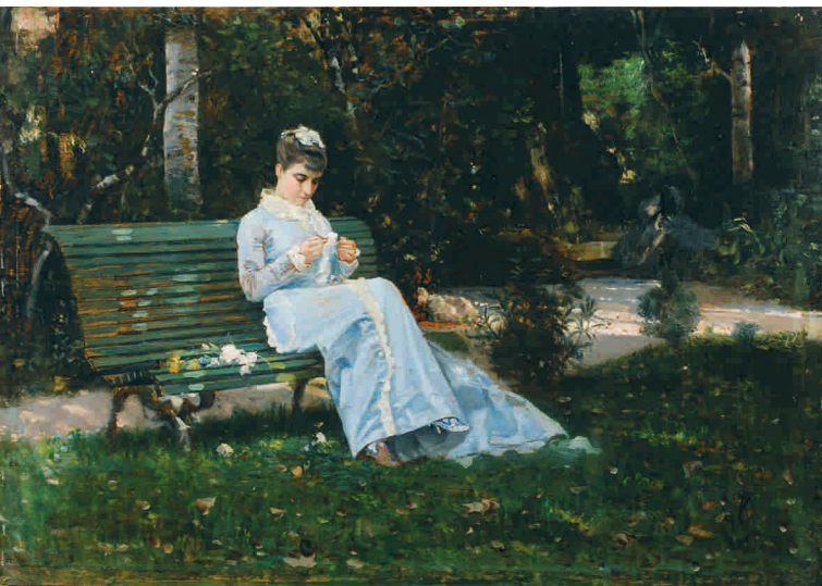
Cristiano Banti: “Alaide in giardino” olio su tavola, c. 1870-1875 - Collezione eredi Banti

(fotografie, lettere, taccuini), mentre la terza sezione è costituita da una ventina di dipinti di Banti, scelti allo scopo d'illustrare tutto il suo percorso artistico. La mostra è aperta il giovedì e venerdì dalle 15 alle 19, il sabato e la domenica dalle 10 alle 19. Aperture straordinarie: Pasqua (20 aprile) dalle 15 alle 19, Pasquetta (21 aprile) e 25 aprile ore 10-19, il 26 aprile apertura straordinaria dalle 10 alle 22, 1 maggio dalle 10 alle 19 e sabato 3 maggio dalle 16 alle 19. Il biglietto d'ingresso costa 5 euro, ma sono previste varie agevolazioni. Maggiori informazioni sulla mostra e sugli eventi collaterali si trovano sul sito www.cristianobantimontemurlo.com mentre per le prenotazioni è disponibile un recapito telefonico (366 2431344).