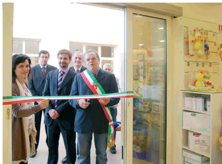
Il taglio del nastro alla Farmacia di Oste

farmacie, di cui due a Montemurlo e Oste, e vicino a ciascuna di esse sono stati creati degli studi medici dove operano medici di base e vari specialisti . “In questo modo mettiamo a disposizione dei cittadini importanti servizi per la salute ed il benessere ” - conclude l'assessore - “Ogni anno promuoviamo una campagna di prevenzione . Nel 2013, in collaborazione con ANT (associazione nazionale tumori) abbiamo lavorato sulla prevenzione del melanoma. In tempi di crisi è facile prestare meno attenzione alla salute e proprio per questo lavoriamo affinché tutti abbiano la possibilità di prevenire importanti patologie”. Farmacom è impegnata anche in operazioni umanitarie ed ogni anno spedisce un pacco di medicinali e di altro materiale sanitario al popolo saharawi, esiliato da quarant'anni nell'insospitale deserto algerino, oltre che alle popolazioni dell'Etiopia.