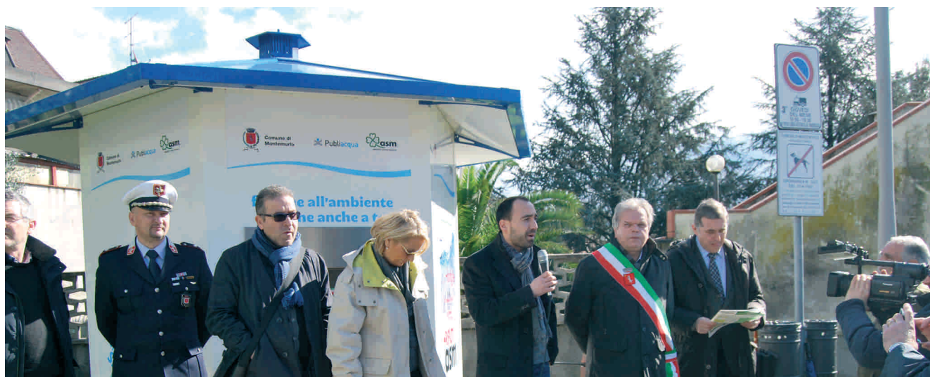
L'inaugurazione del fontanello a Bagnolo

nel piano di riduzione dei rifiuti, aumento della raccolta differenziata e miglioramento del decoro e della pulizia della città, lo scorso marzo è stato inaugurato il nuovo Centro raccolta in via Puccini a Oste . Con oltre un milione di euro d'investimento, il centro servirà a massimizzare i risultati, già molto positivi, della raccolta differenziata. Qui si potranno conferire in autonomia durante gli orari d'apertura rifiuti ingombranti e pericolosi (come vernici, oli esausti, e altro) non trattati dal servizio porta a porta . Inoltre, nella parte nord del centro sarà realizzata una zona destinata alla consegna dei rifiuti da parte dei cittadini, anche nell'orario di chiusura, attraverso portelli che metteranno in comunicazione l'area esterna al centro di raccolta con dei cassonetti interni. Il sindaco si augura che il centro possa presto diventare anche un punto per il riuso e lo scambio tra cittadini, per dare nuova vita ad oggetti ormai inutilizzati evitando che diventino rifiuti.