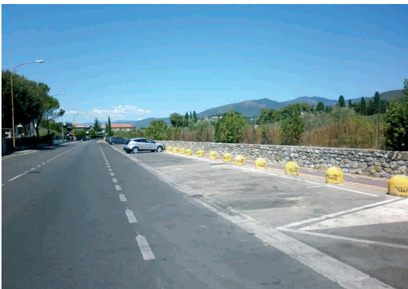
Via Montalese, prima e dopo l'introduzione della raccolta porta a porta