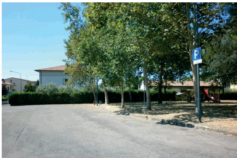
Via Leoncavallo, prima e dopo l'introduzione della raccolta porta a porta