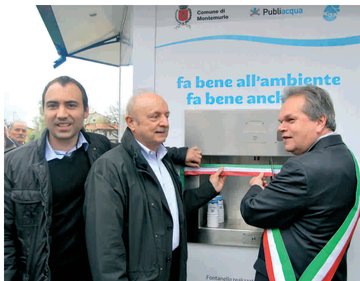
L'inaugurazione del fontanello

ma anche accessori per auto e moto, articoli per la casa, pavimentazioni, persiane per prefabbricati, accessori per agroindustria... Montemurlo, insomma, un comune sempre più verde, non solo a parole, ma nei gesti e nelle azioni compiute quotidianamente. "Il 2013 sarà dedicato al miglioramento del decoro urbano - conclude Calamai - vogliamo che la nostra città sia sempre più bella, pulita e accogliente e per realizzare quest'obiettivo c'è bisogno della collaborazione di tutti".