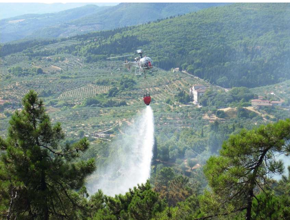
Lo spegnimento di un incendio

emergenze e per coordinare le azioni di soccorso alla popolazione tra i vari enti presenti sul territorio (Provincia, Regione, Prefettura). Inoltre, il piano ha fatto una sorta di censimento delle strutture che potrebbero essere utilizzate per il ricovero della popolazione evacuata (scuole, palestre...), le aree per l'atterraggio di elicotteri e ha individuato le "aree d'attesa", cioè quelle zone di prima accoglienza, dove la popolazione potrà essere tempestivamente soccorsa dalla protezione civile (a breve saranno installati specifici cartelli che individuano queste aree). Insomma, il piano è una sorta di "vademecum delle buone pratiche" che dovrà servire agli operatori della protezione civile per lavorare meglio e in maniera più efficace, ma anche ai cittadini per evitare inutili rischi. "L'informazione della popolazione riveste una componente essenziale per ogni Piano di protezione