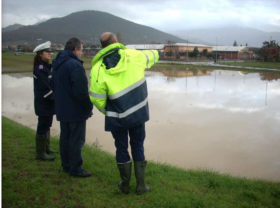
Sopralluogo del sindaco insieme alla polizia municipale

e i canali informativi della viabilità. Prima dell'inizio delle piogge, mettere in salvo i beni collocati in locali allagabili. Non sostare in cantine e nei locali seminterrati. Evitare di sostare nelle zone circostanti gli alvei dei corsi d'acqua e limitare gli spostamenti, in particolare in aree montane e in particolare nei tratti esposti a frane e caduta massi. Mettersi in viaggio solo se necessario, procedendo a velocità ridotta e prestando la massima attenzione alla presenza di detriti (sassi o fango) in strada e avvisare i vigili del fuoco se si nota la caduta di detriti sulla strada. Evitare gli attraversamenti dei corsi d'acqua (ponti o guadi) e le zone depresse (sottopassi, zone di bonifica). Se la propria casa si trova in una zona a