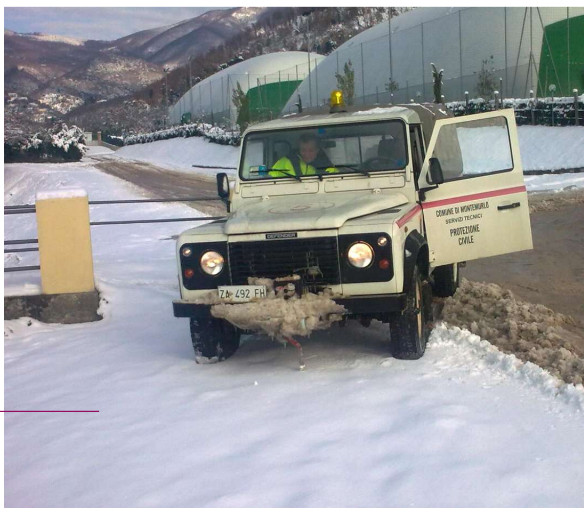
Intervento durante l'emergenza neve dello scorso anno

In caso di forti piogge è opportuno tenersi aggiornati sull'evoluzione delle condizioni meteo e seguire le indicazioni dell'autorità di protezione civile locale