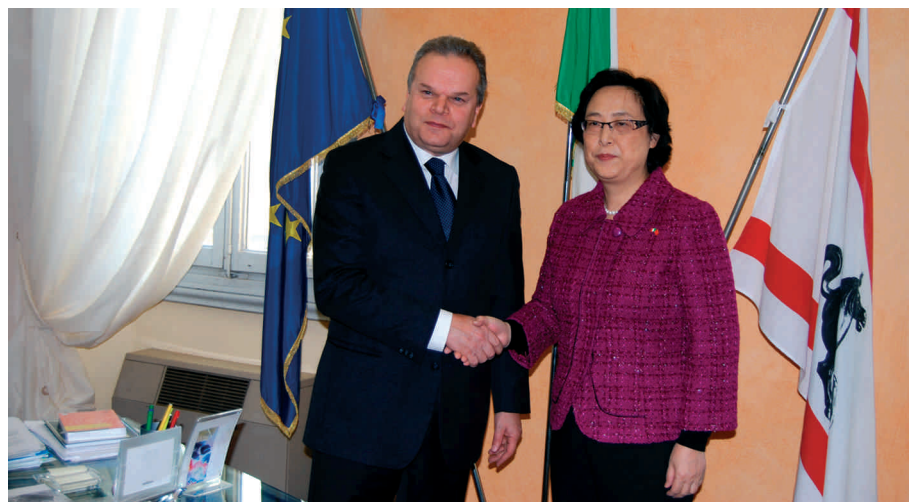
Il sindaco Mauro Lorenzini e la Console generale cinese Zhou Yunqi

cioè proprio quello che producono le nostre aziende. Aver avviato un dialogo con il consolato cinese significa costruirsi un canale privilegiato di penetrazione commerciale. Vorrei che il distretto pratese non facesse l’errore della Fiat, che per anni ha snobbato il grande mercato asiatico ed ora vi si vendono auto-