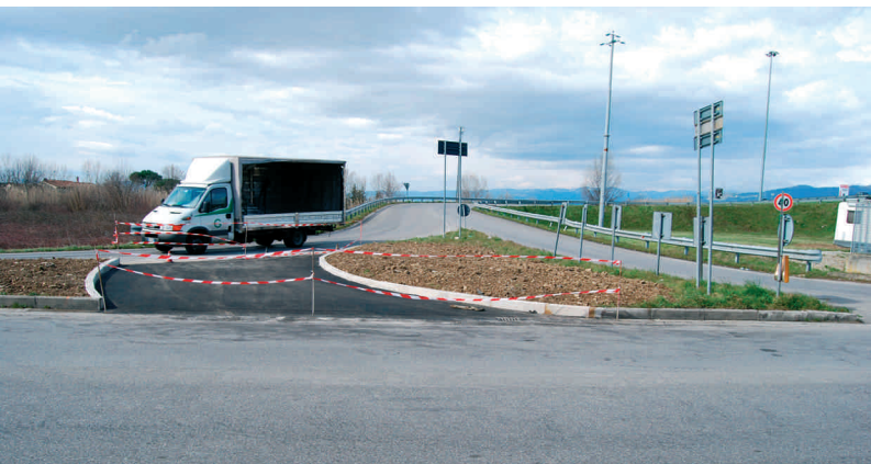
Lo svincolo in via Labriola

Un'attenzione particolare e costante per la manutenzione e la gestione del patrimonio pubblico. Il Comune di Montemurlo ogni anno investe molti fondi del proprio bilancio per mantenere in buono stato strade, edifici e spazi pubblici. “Attraverso una programmazione rigorosa e una gestione oculata delle risorse a nostra disposizione, anche nonostante i tagli dei trasferimenti e le regole stringenti che ci impone